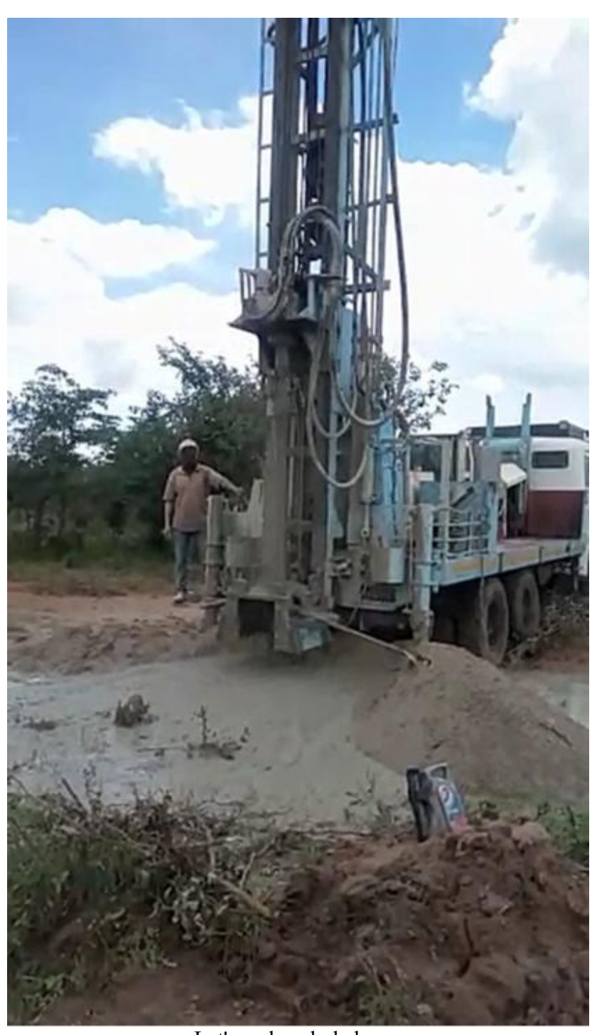
Let's make a hole here.