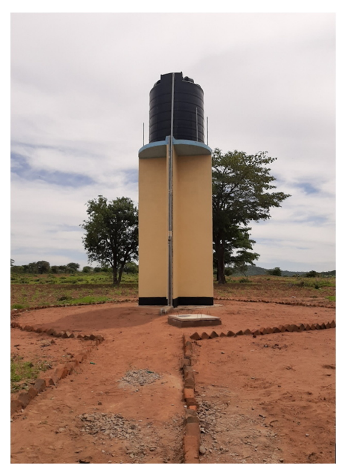
The main tank