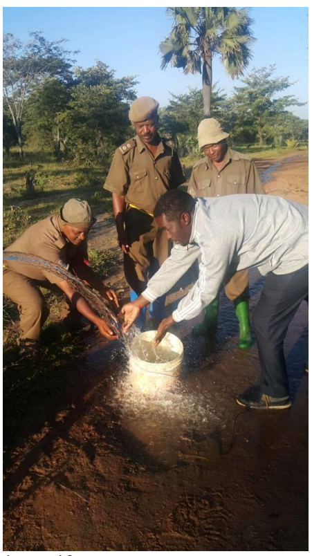
The water. A precious gift