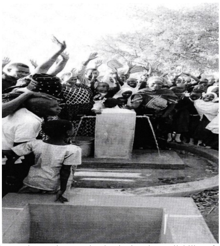
Community and Pupils at Ushora Primary school enjoying the availability of water as success of the project.