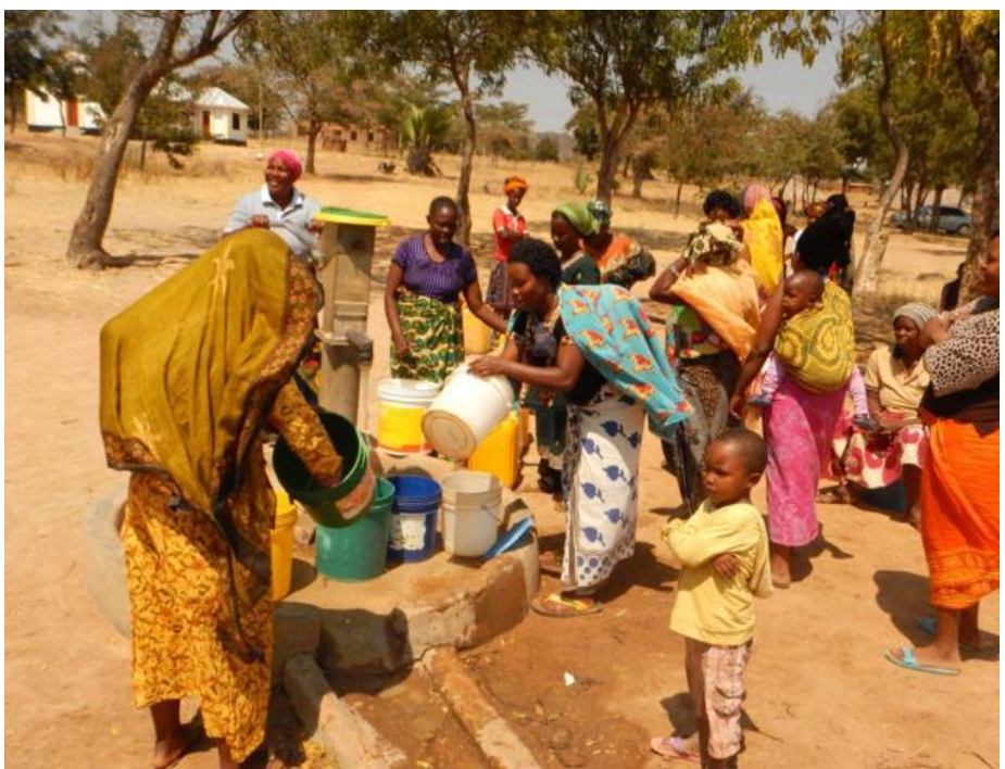
The pre-existing manual well with its single supply point