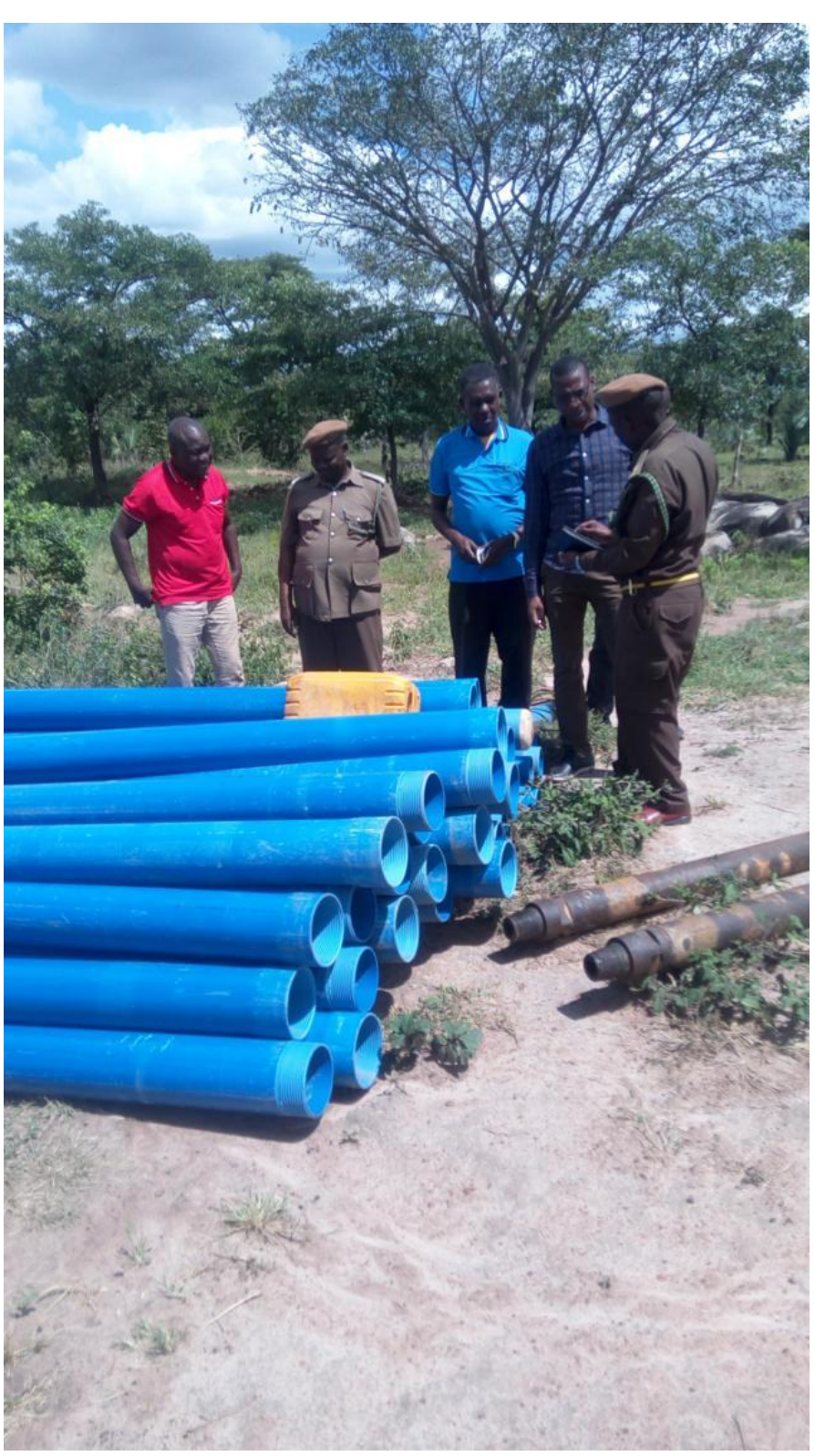
The supplies arrive